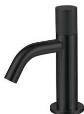
PVD Black Réf. A32444