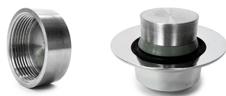
Inox Réf. A62460