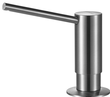
Inox Réf. A51409